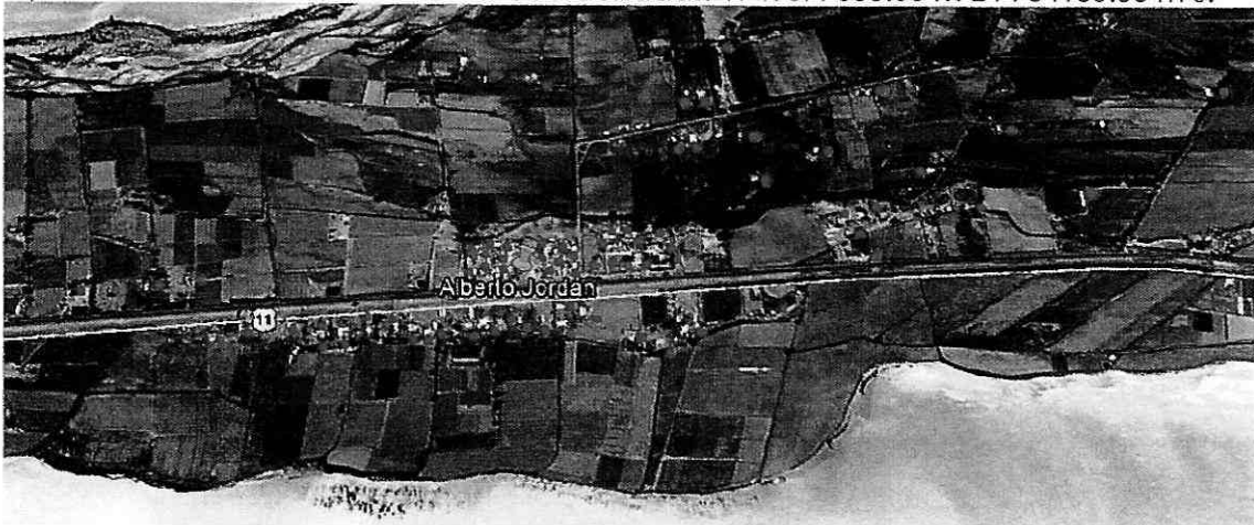
Figura 1. Sector de Alberto Jordán

Como punto de referencia se tienen las coordenadas: 19 K 377650.00 m E 7964150.00 m S.