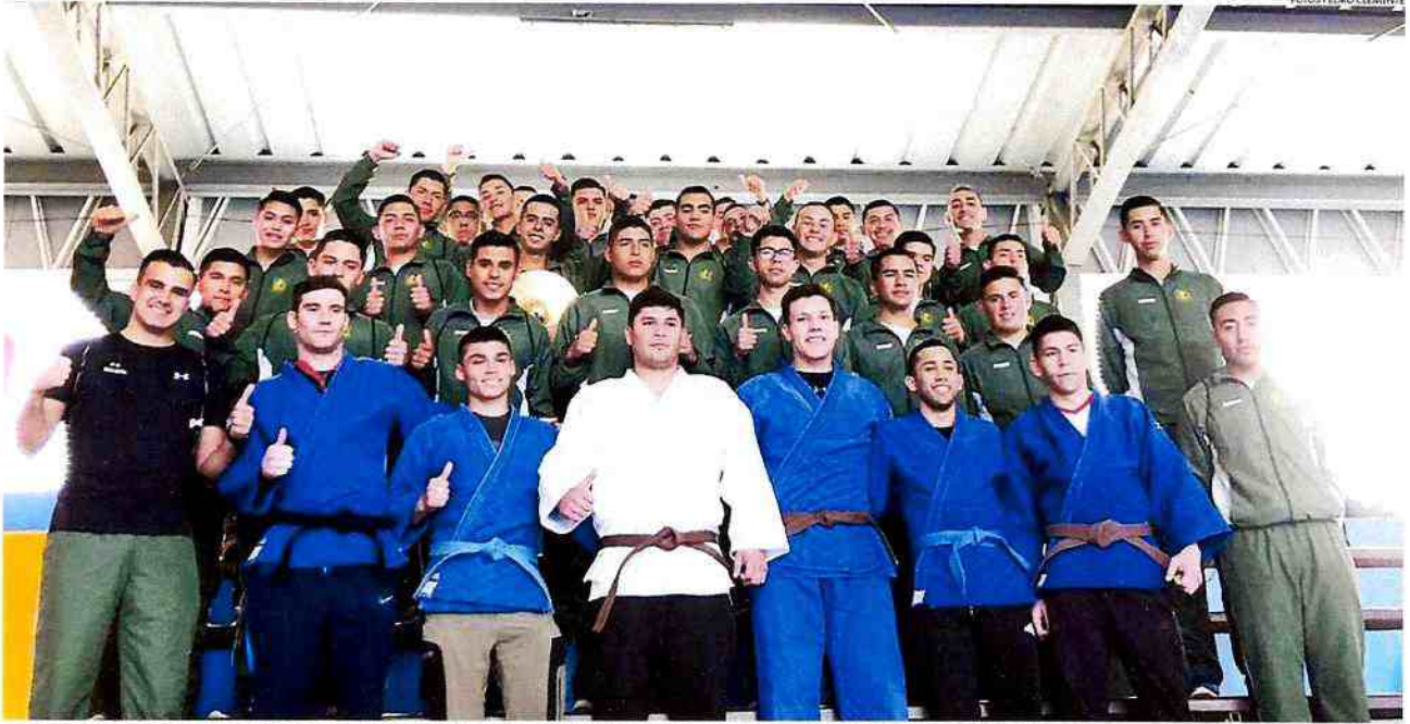
LA DELEGACIÓN DE JUDOCAS DE LA ESCUELA DE CARABINEROS DE SANTIAGO JUNTO A LA BARRA QUE LOS APOYA EN EL CAMPEONATO NACIONAL DE JUDO FEDERADO.