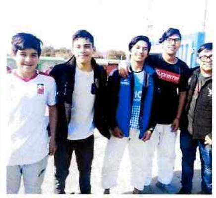
JÓVENES JUDOCAS DE DIFERENTES ACADEMIAS DE ARICA.

Para el dirigente, lo otro importante es que "la comunidad ariqueña se ha ido integrando a estos eventos y estamos cumpliendo con la expectativa que teníamos con este nacional".