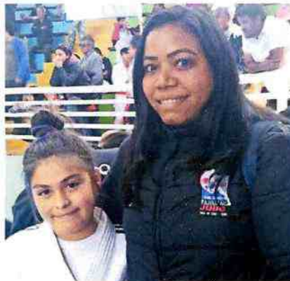
LA ENTRENADORA VENEZOLANA JUNTO A UNA DE SUS JUDOCAS.

La entrenadora lleva un año a cargo de esta acade-