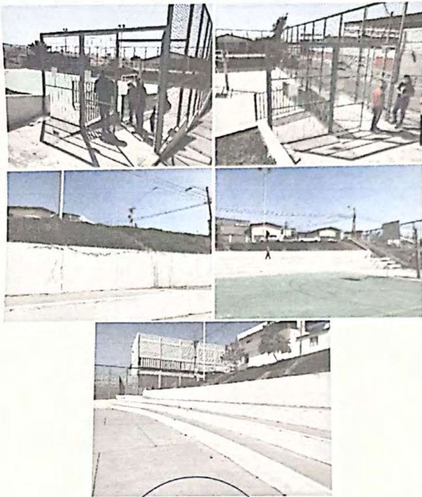
Imagen: Supervisión en Terreno. Octubre 2021