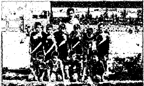
Deportivo Pasajero debió goleando en el torneo.