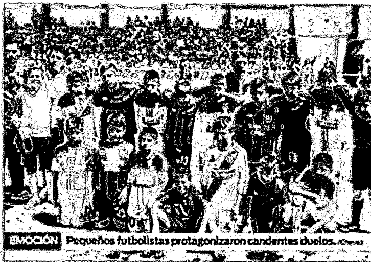
EMOCIÓN Pequeños futbolistas protagonizaron candentes duelos.

En sub 11, Strochil de La Serena 0-0 Cantón San Manuel y Komatsu de Quique 2-0 Defensores de Cuzco. Por la categoría sub 13, EGB (México) 1-1 EGB (Chile). En la sub 15, Cantón Tacna 1-1 EGB Tacna, y Club Arsenal (Chile) 3-0 EGB Tacna.