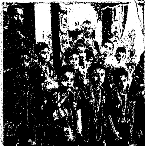
BARCELONA DE ARICA