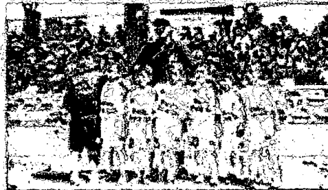
Real Tacna promete ser protagonista en dos categorías.