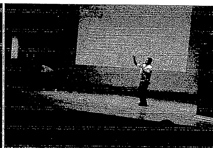
Seminario de Espectro del autismo Aula Magna UTA