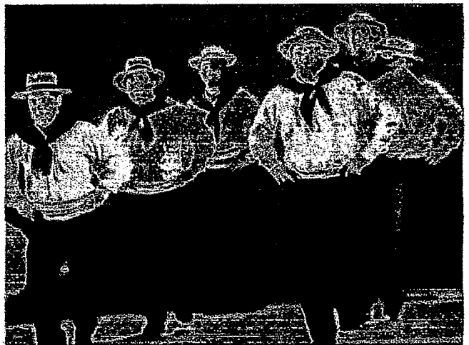
EN TOTAL FUERON 125 LOS PROFESORES QUE ASISTIERON AL ENCUENTRO.

mera vez que viajan a presentarse a la puerta norte del país. “Trajimos una obra de folclore infantil con juegos, rondas y canciones y también con la danza paraguaya con quien tenemos un intercambio cultural”.