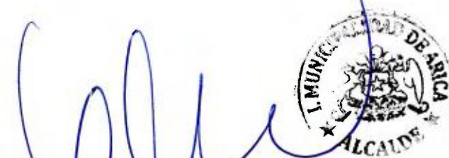
GERARDO ALFREDO ESPÍNDOLA ROJAS Alcalde Ilustre Municipalidad de Arica