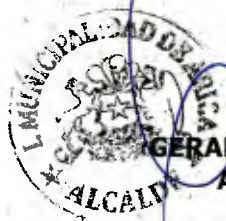
GERARDO ESPINDOLA ROJAS ALCALDE DE ARICA