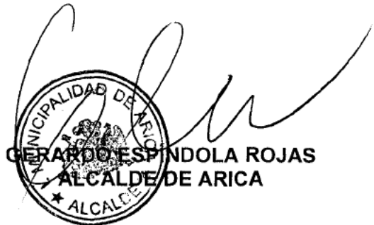
GERARDO ESPINDOLA ROJAS ALCALDE DE ARICA