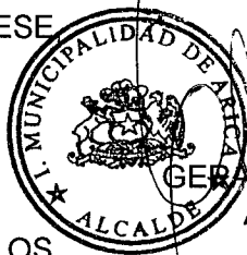
GERARDO ESPINDOLA ROJAS ALCALDE DE ARICA