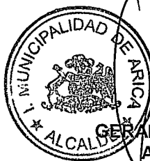
GERARDO ESPINDOLA ROJAS ALCALDE DE ARICA