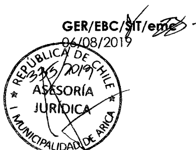
GERARDO ESPÍNDOLA ROJAS ALCALDE DE ARICA