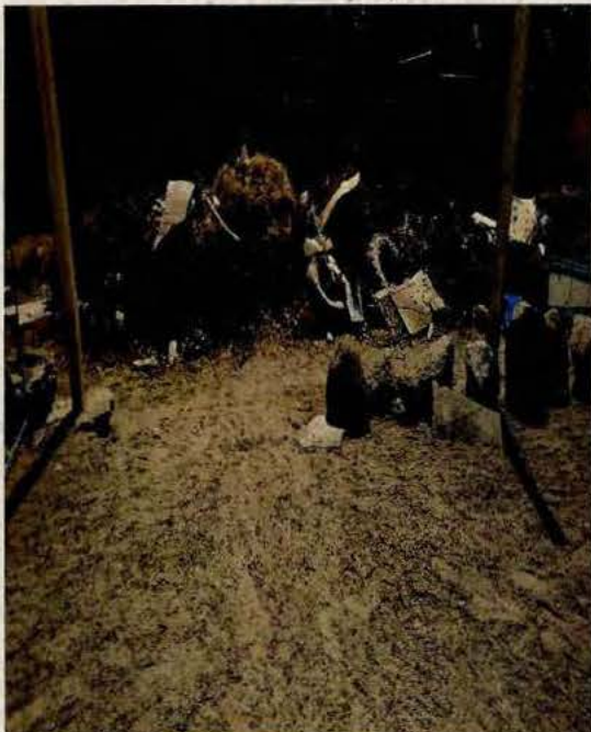
N° 3, Apertura en cierre perimetral.