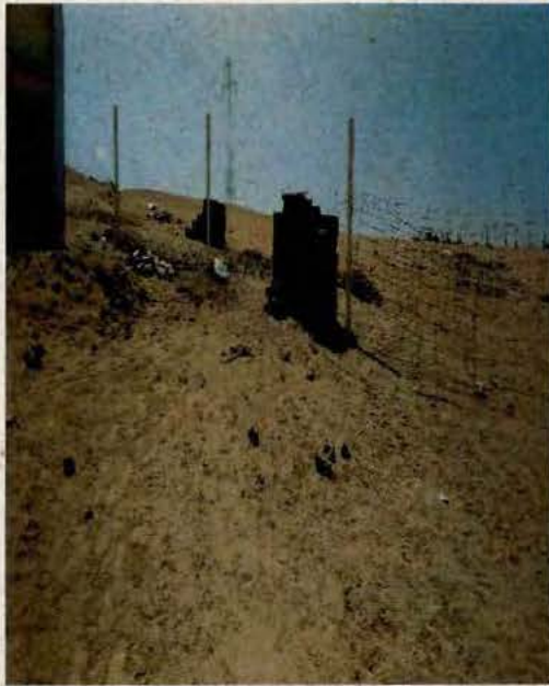
N° 1, Apertura en cierre perimetral.