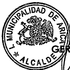
GERARDO ESPINDOLA ROJAS ALCALDE DE ARICA