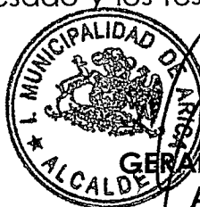
GERARDO ESPINDOLA ROJAS ALCALDE DE ARICA