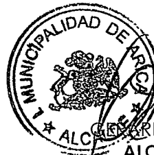
GERARDO ESPÍNDOLA ROJAS ALCALDE DE ARICA