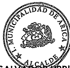
SALVADOR URRUTIA CARDENAS ALCALDE DE ARICA