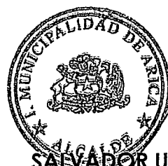
SALVADOR URRUTIA CARDENAS ALCALDE DE ARICA

El presente contrato se redacta en 6 ejemplares, quedando uno en poder del Interesado y los restantes en la I. Municipalidad de Arica.