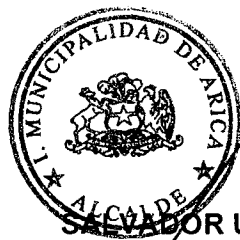
SAVADOR URRUTIA CÁRDENAS ALCALDE ILUSTRE MUNICIPALIDAD DE ARICA