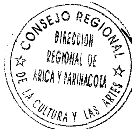
VERÓNICA ZORZANO BETANCOURT DIRECTORA REGIONAL DE ARICA Y PARINACOTA CONSEJO NACIONAL DE LA CULTURA Y LAS ARTES