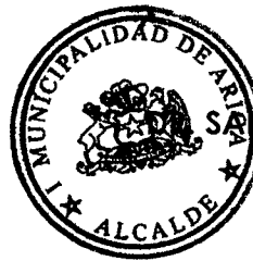
SAVADOR URRUTIA CARDENAS ALCALDE DE ARICA