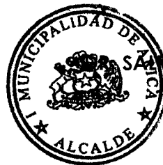
SAVADOR URRUTIA CARDENAS ALCALDE DE ARICA