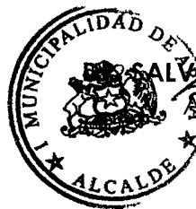
SALVADOR URRUTIA CARDENAS ALCALDE DE ARICA