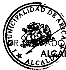
ROBERTO BLAS TICONA ALCALDE DE ARICA