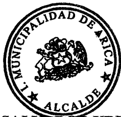
SALVADOR URRUTIA CARDENAS Alcalde I. Municipalidad de Arica