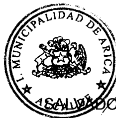
ALFONSO URRUTIA CÁRDENAS ALCALDE I. MUNICIPALIDAD DE ARICA