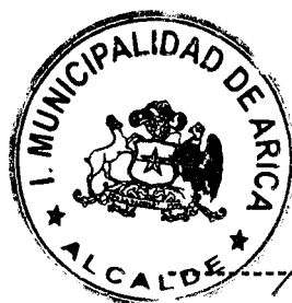
SALVADOR PEDRO URRUTIA CARDENAS ALCALDE DE ARICA