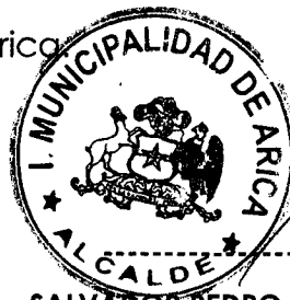
SALVADOR PEDRO URRUTIA CARDENAS ALCALDE DE ARICA