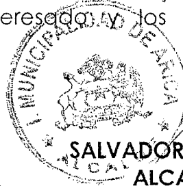
SALVADOR URRUTIA CARDENAS ALCALDE DE ARICA