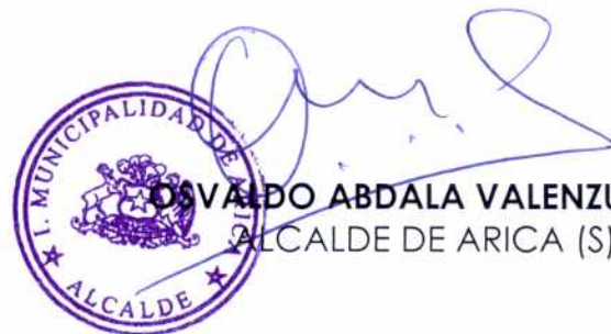
OSVALDO ABDALA VALENZUELA ALCALDE DE ARICA (S)