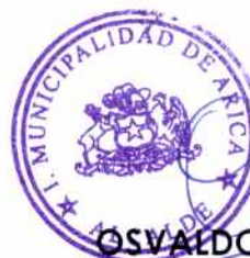
OSVALDO ABDALA VALENZUELA ALCALDE DE ARICA (S)