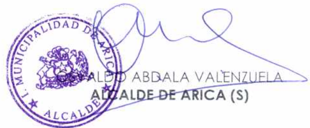
ABDALO ABDALA VALENZUELA ALCALDE DE ARICA (S)