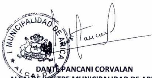
DANTE PANCANI CORVALAN ALCALDE ILUSTRE MUNICIPALIDAD DE ARICA (S)